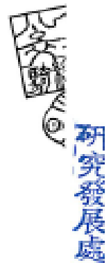
表 訂 錄