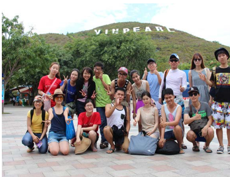
Korean Exchange Students

HCMUE has established international cooperation with over 100 Universities and Institutes, Organizations, None-government Organizations and Companies in over 30 countries. Many successful collaborative agreements have been developed between international universities and organizations and HCMUE in undergraduate and post-graduate training. The university has sent many lecturers to teach